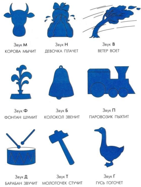
Рисунок № 2