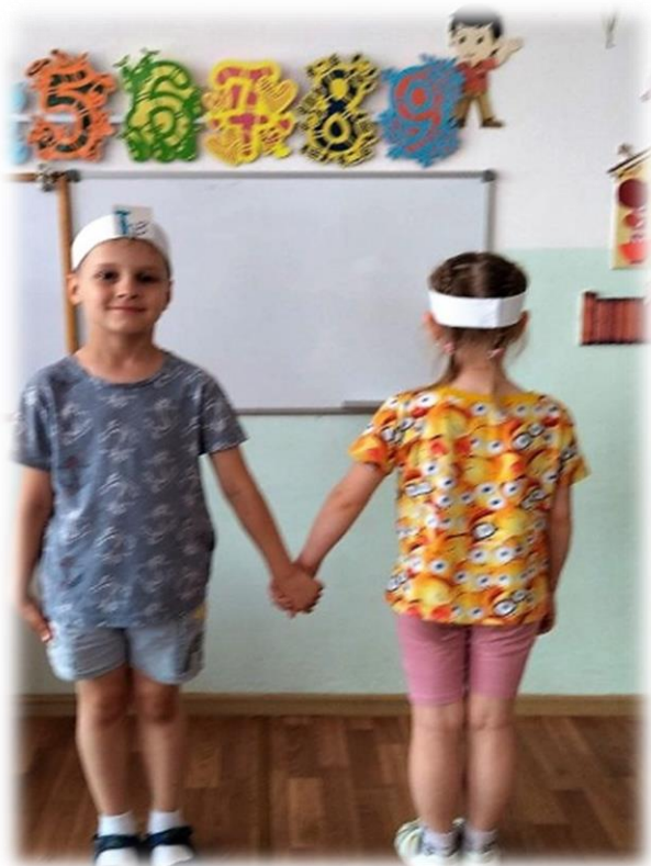
Рисунок № 2