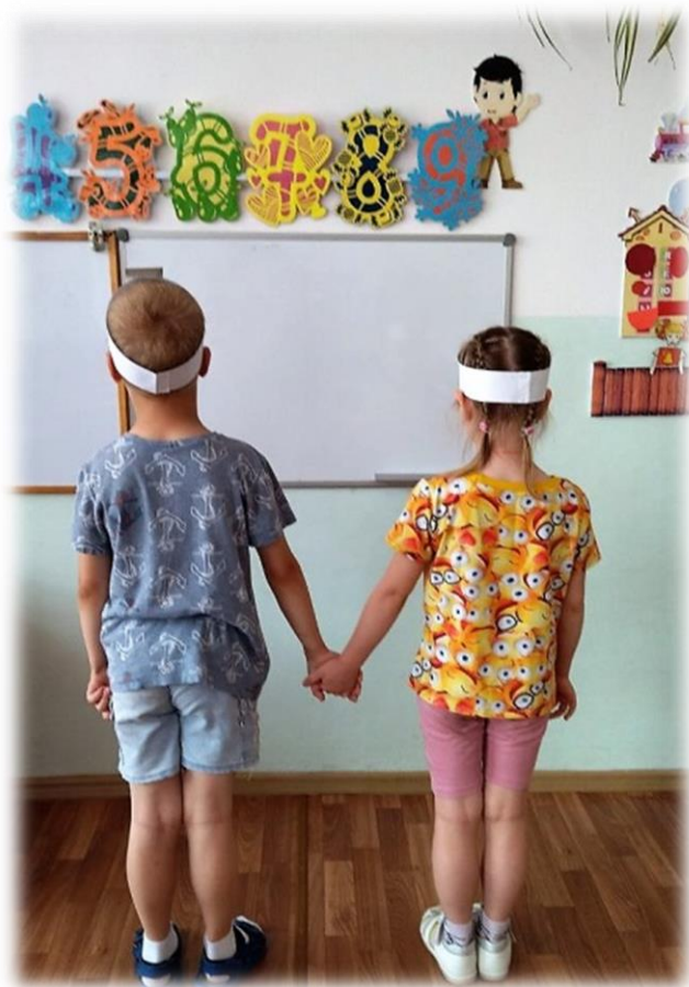
Рисунок № 4