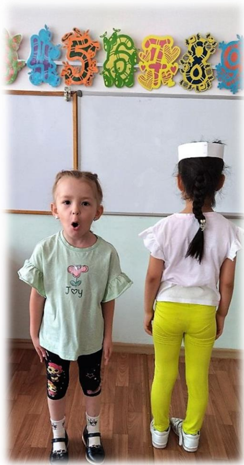
Рисунок № 6