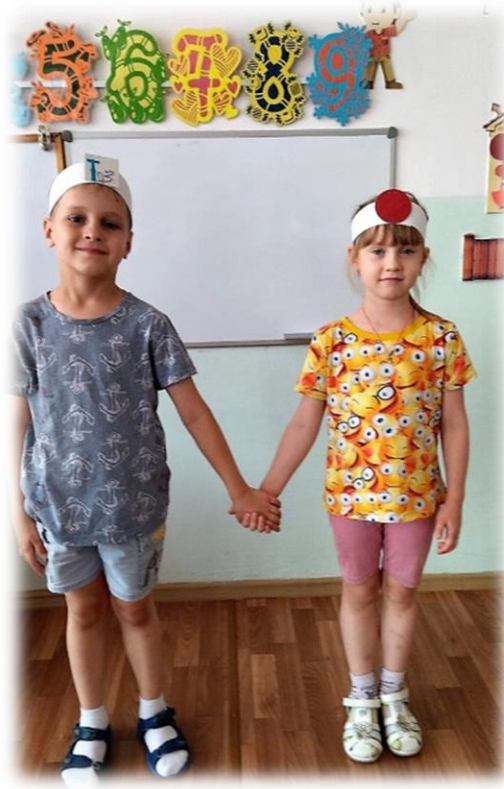
Рисунок № 3