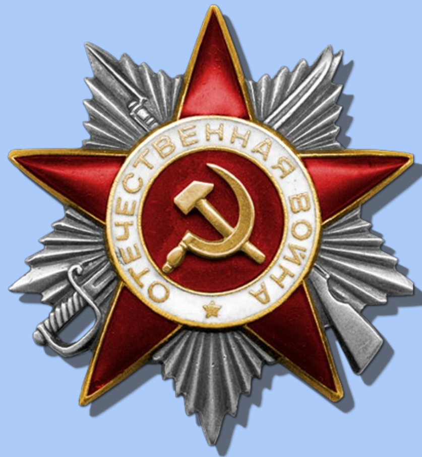
На фото Орден Отечественной войны II степени

Каждое 9 мая он водружал на дом большой красный флаг, а за большим столом собирались все родственники.