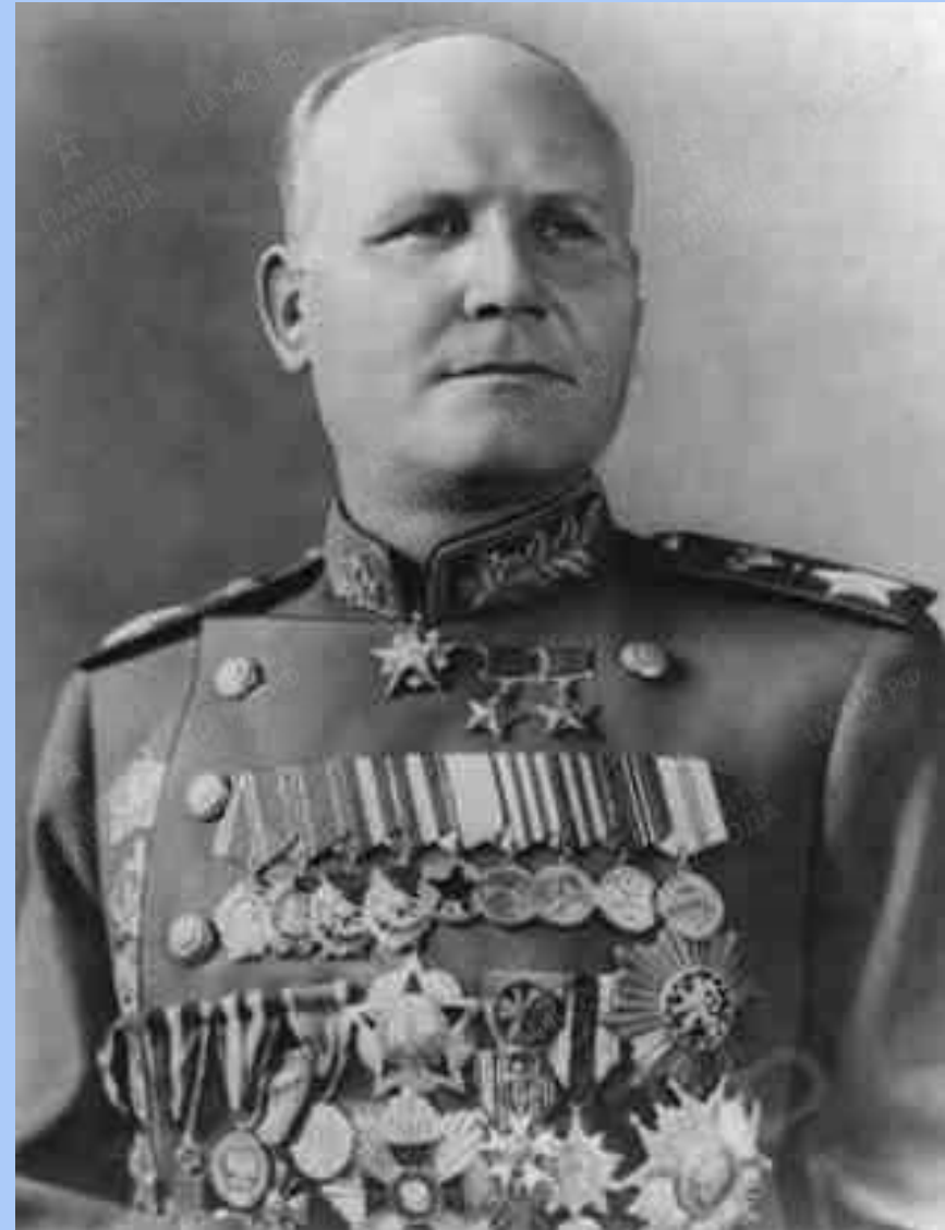
Маршал Советского союза Конев Иван Степанович

После артиллерийской подготовки Алексей Харитонович видел ужасную картину: немецкие танки были словно закопаны от ударов нашей