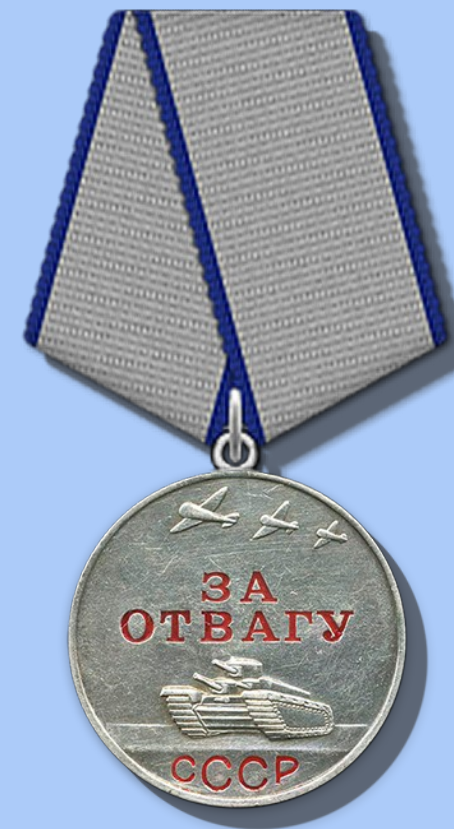
На фото Наградной лист и медаль за отвагу